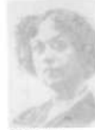
Kollontai En Suecia